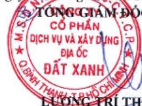
LƯƠNG TRÍ THÌN